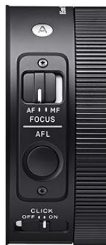
Commutateur de mode AF/MF Bouton AFL Commutateur de bague de diaphragme