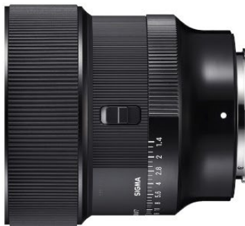
Commutateur de verrouillage de la bague de diaphragme

* Utilisation limitée aux appareils compatibles. De plus, les fonctions dépendent de l'appareil utilisé.