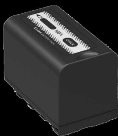
Batterie Li-ion AG-VBR59E EAN : 5025232836475