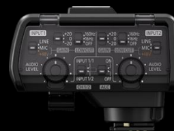
Module XLR DMW-XLRIE EAN : 5025232857364