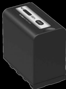
Batterie Li-ion AG-VBR89GC EAN : 4010869254175