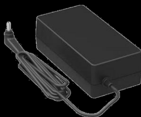
Double Chargeur AG-BRD50E EAN : 5025232834068