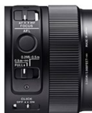
■ Commutateur de mode de mise au point ■ Bouton AFL ■ Commutateur de bague de diaphragme