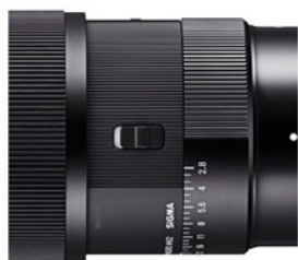
■ Commutateur de verrouillage de la bague de diaphragme

* Utilisation limitée aux appareils compatibles. De plus, les fonctions dépendent de l'appareil utilisé.