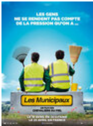
Les Municipaux, ces héros