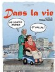
Dans la vie