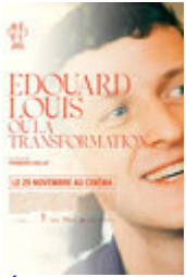
Édouard Louis, ou la transformation

2013 Best Cinematography Documentary Film for Mustafa's Sweet Dreams 1 Cinematographer Laurent Fénart SEEFest - Los Angeles