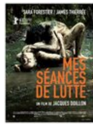
Mes séances de lutte