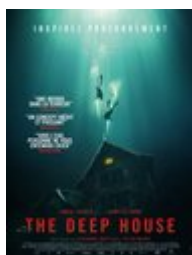
The Deep house

Peugeot | Renault | Volkswagen | Audi | Mazda | Nissan | Ferrari | Buick | Dacia | Rolex | Tudor | Tag Heuer | Empreinte | Mac Donalds | Dior | Yoplait | Diesel | Samsung | L'Or Maison du Café | La prairie | Ubisoft | SNCF | Téva | Hôtels Kyriad et Campanile | M6 Mobile | Guy Savoy | Perrier | Captain Cola | Mennen | Johnny Walker | Skybet | etc.