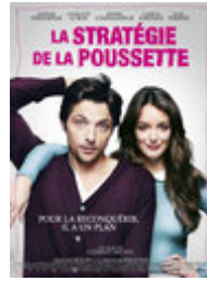
La Stratégie de la poussette