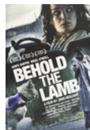
Behold the Lamb