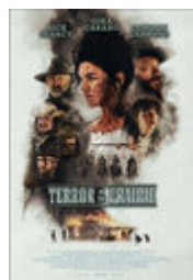
Terror on the Prairie (English version)