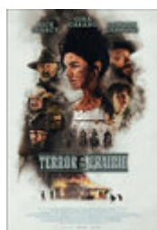
Terror on the Prairie