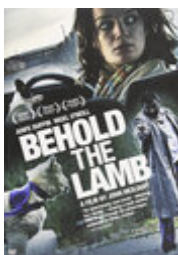
Behold the Lamb