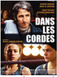
Dans les cordes