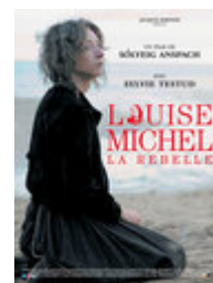
Louise Michel, la rebelle