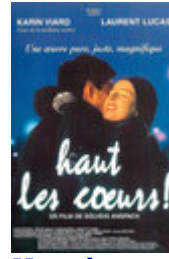
Haut les cœurs !