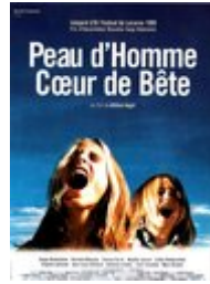
Peau d'homme, cœur de bête