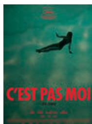
C'est pas moi