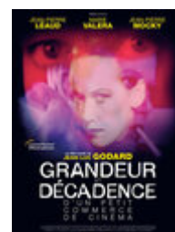
Grandeur et décadence d'un petit commerce de cinéma