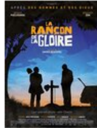
La Rançon de la gloire