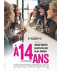
A 14 ans