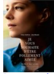
Je vous souhaitez d'être follement aimée