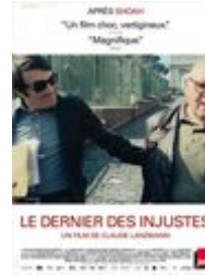
Le Dernier des injustes