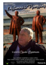
L'Automne à Pyongyang, un portrait de Claude Lanzmann