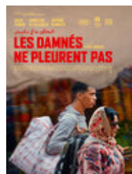
Les Damnés ne pleurent pas