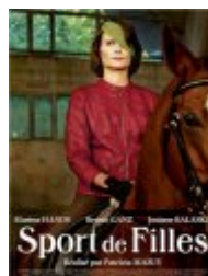
Sport de filles