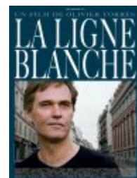
La Ligne blanche