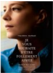
Je vous souhaite d'être follement aimée