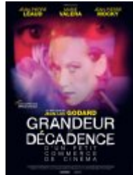
Grandeur et décadence d'un petit commerce de cinéma