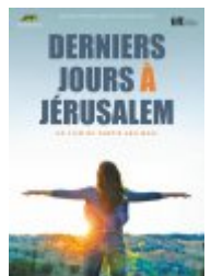
Derniers jours à Jérusalem