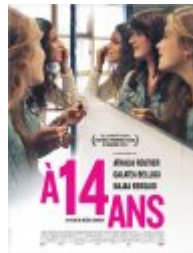
A 14 ans