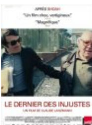
Le Dernier des injustes