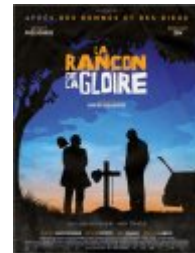
La Rançon de la gloire