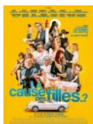
A cause des filles..?