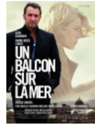
Un balcon sur la mer