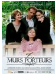
Les Murs porteurs