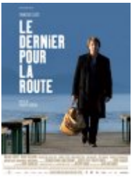
Le Dernier pour la route