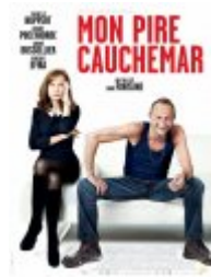
Mon pire cauchemar