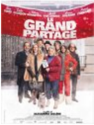
Le Grand partage