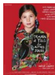
Demain et tous les autres jours