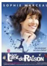
L'Age de raison