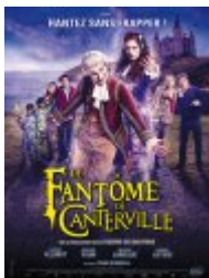
Le Fantôme de Canterville