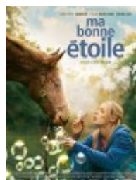
Ma bonne étoile