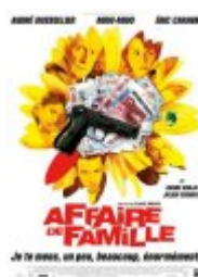
Affaire de famille