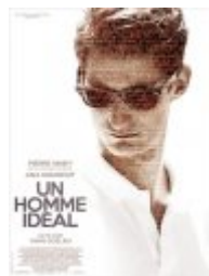
Un homme idéal