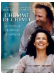
L'Homme de chevet