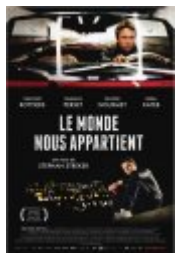
Le monde nous appartient