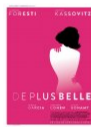
De plus belle